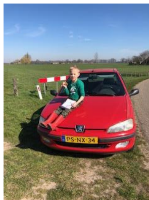
Bodhi doet een autodictee!