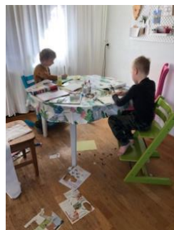
Saybia en Bodhi maken kaartjes voor de burenl

Een van de drie kernwaarden van de Sint Nicolaas is "verbindend".